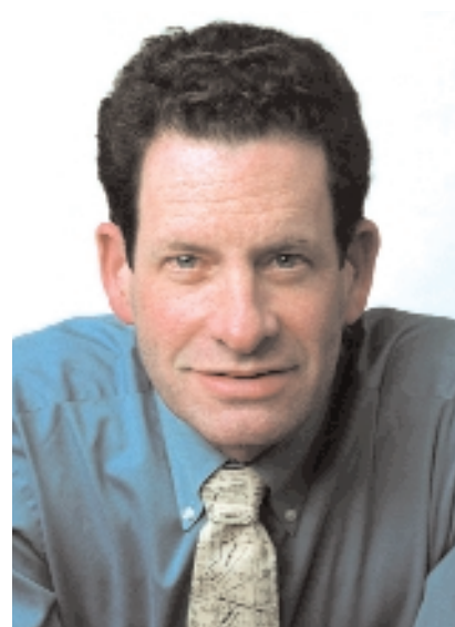
Ken L. Fisher

Damit steht schon einmal fest, was nicht eintreten kann. Was übrig bleibt, sind sogenannte „Löcher“ in den Prognosen der „Profis“, also Aktienmarktentwicklungen, die sie für unwahrscheinlich oder gar unmöglich halten. Oder anders ausgedrückt: Fisher sammelt die Vorhersagen der Analysten (eingeteilt in äquidistante Schätzungintervalle) und prognostiziert dann exakt das, was die wenigsten oder niemand erwartet.