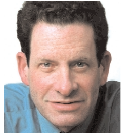
Ken L. Fisher

Ken Fisher: An den negativen Ausgang haben wir nicht geglaubt, weil das einen viel zu großen Bear Market impliziert hätte und andere Sentimentindikatoren bereits gezeigt haben, daß die Leute zu bearish sind. Wir denken, daß die zweite Jahreshälfte sehr positiv ausfallen und zu einem guten Gesamtjahr führen wird.