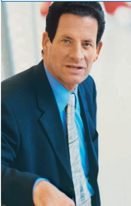
Ken Fisher verwaltet in den USA 42 Milliarden Dollar. Beim Grüner-Fisher-Global-Fonds gibt er die strategische Ausrichtung vor.