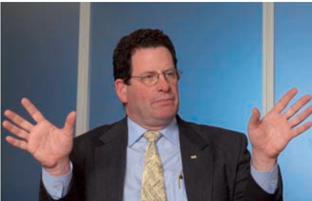
Ken Fisher ist sehr optimistisch für die Aktienmärkte